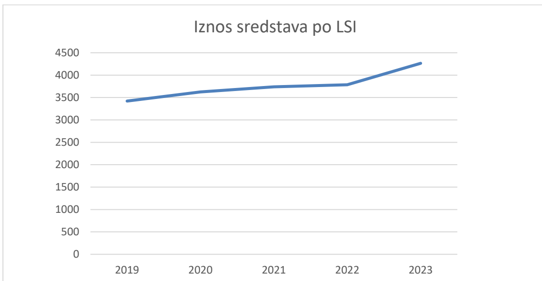
Grafikon 3. Iznos sredstava za podršku po LSI u KM