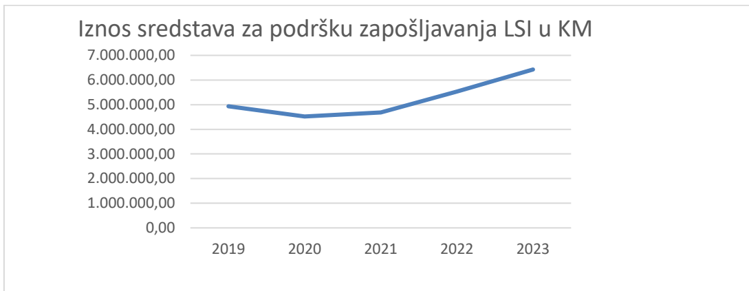
Grafikon 1. Ukupan iznos sredstava za podršku zapošljavanja LSI